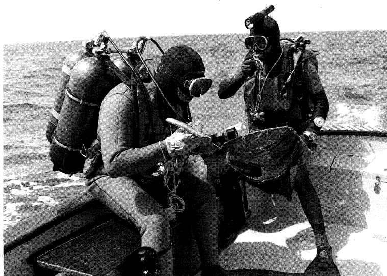
Fig. 1 The pink coral divers on the board

15リットルシリンダー(220気圧充填)が1本の合計3本を使用していた。ウェイトは、3本のシリンダーが重く、オーバーウェイトになってしまうため装着はしない。また、バラシングベストは、パワーインフレーター(浮力調整具)を装着していた。減圧の際の呼吸ガスホース(酸素、空気)には、交信ケーブル、温水ホースなどを組み合わせ、一つに束ねて使用していた。温水は約40℃あり、船上の湯沸器で作り、高圧ポンプでダイバーまで送っていた。交信には、通常のマイクスピーカーとアンプを用い、ヘリウムボイス変換器は使用していなかった。船上の再圧室は容積2.3m 3 の単室型で、素材には軽量ケブラーを使用し最大加圧々力3bar、酸素呼吸装置はCOMEX社製のダイビングシステムで、呼出酸素を室外へ放出するようにしていた。